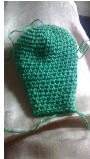
fin du corps à 20 mailles, 9cm de hauteur