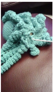
fermer en crochant en rond

Alterner : 2 mailles serrées, 3 mailles serrées longueur 20 cm