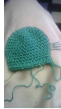
15 è tour, 6