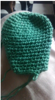
21 è tour, 4,5 cm