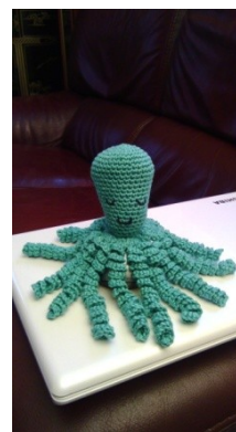
prête à partir !