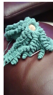
crocheter 10 à 12