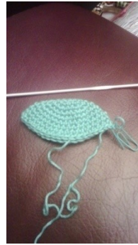
10 è tour, 7 cm de large