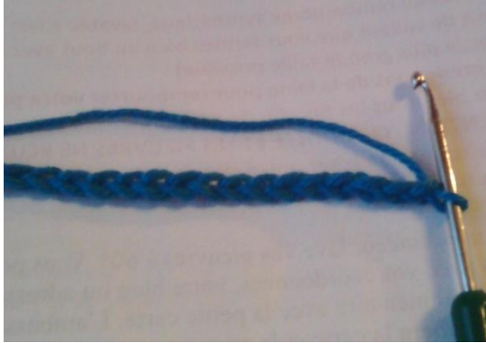
Faire une chaînette de 60 mailles