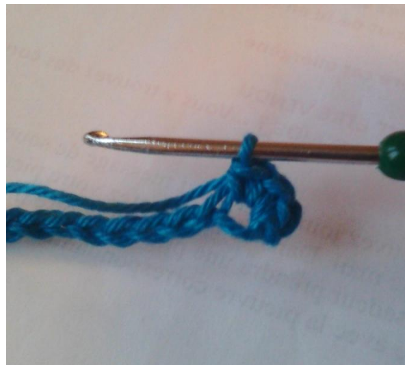
Photo 3 . Il y a 3 mailles ensemble dans une maille de chaînette