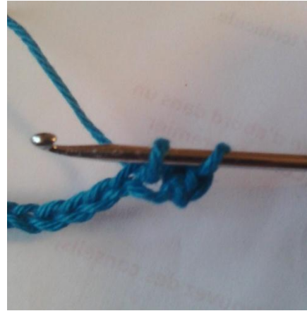
dans la 1 ère maille de cette chaînette, crocheter 3 mailles (voir photo 2 et 3)