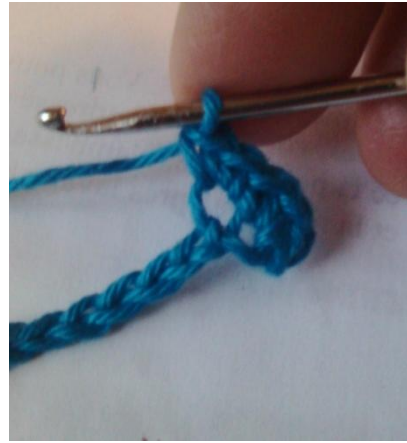
Crocheter dedans 2 mailles