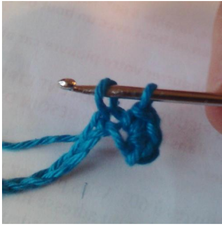
Passer à la 2ème maille de la chaînette